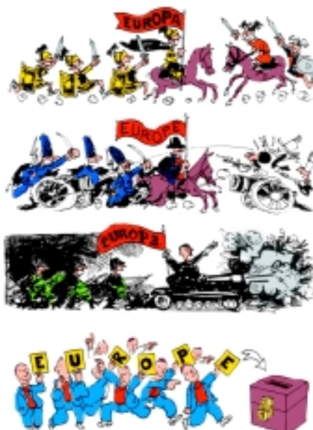
A Europa vista pelo desenhista francês Plantu.

(NEMBRINI, Jean-Louis, et al. Géographie – à monde ouvert . Paris: Hachette, 1996.)